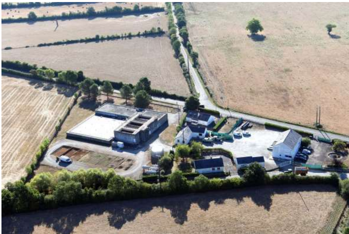
Usine de Campbon, vue du ciel

La nappe de Campbon représente 45% de l'eau utilisée par Saint-Nazaire Agglomération, qui y gère les forages et l'usine de potabilisation. Chaque année, le volume d'eau prélevé varie, en moyenne, entre 8,1 et 8,5 millions de m 3 , pour un volume total de la nappe évalué à environ 100 millions de m 3 .