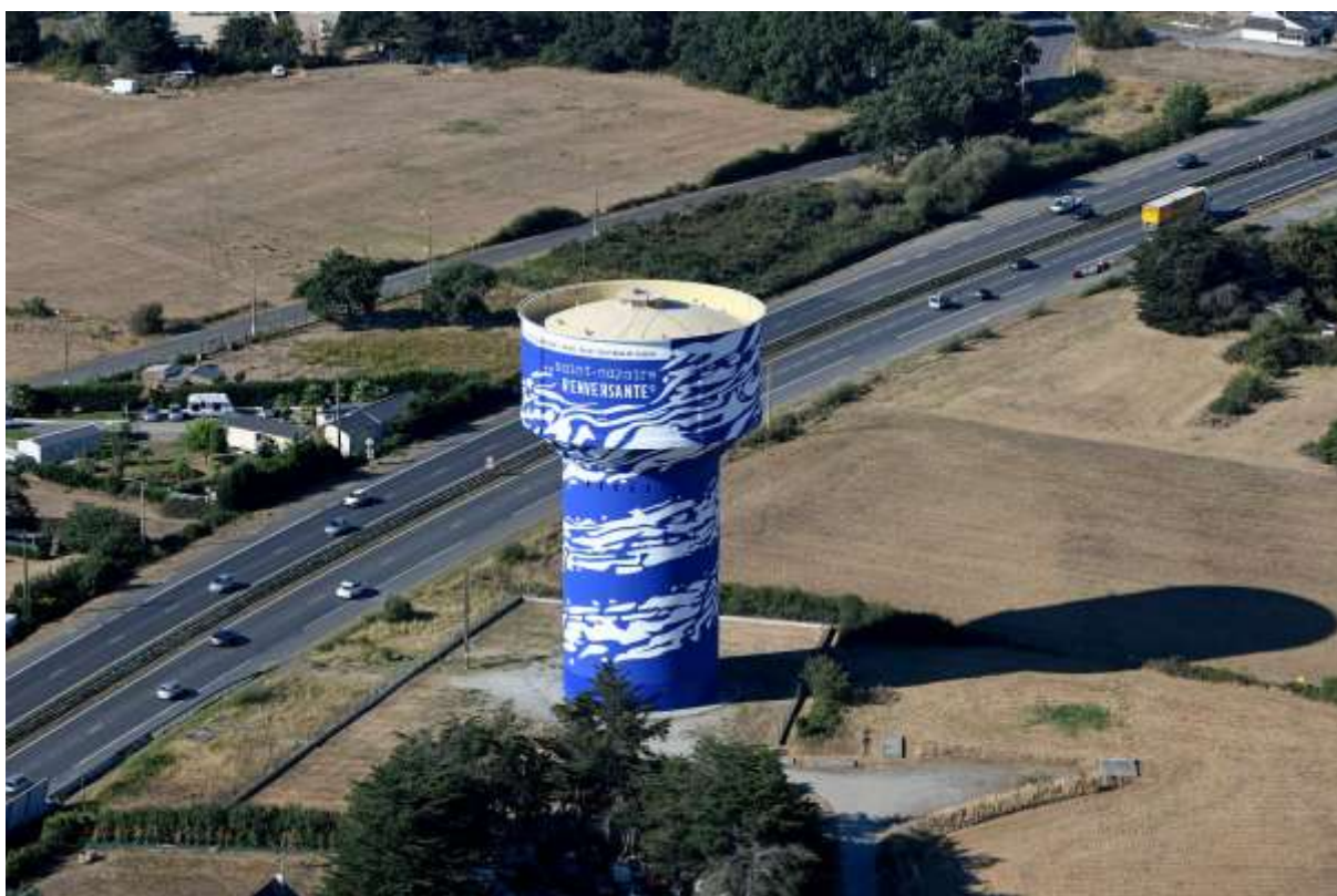
Château d'eau de la Cordonnais, © Martin Launay