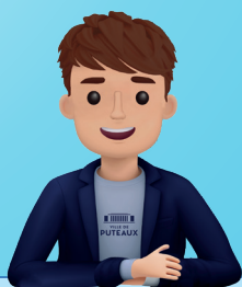
Antoine, votre assistant virtuel 24h/24

Ce lundi 16 septembre, la Ville a dévoilé la nouvelle interface de son site Internet. Pensée pour être plus épurée, intuitive et plus performante, elle s'accompagne également d'un assistant virtuel, Antoine, qui répondra à toutes vos questions.