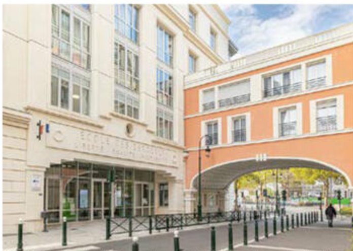
L'école des Bergères, dans l'EcoQuartier éponyme de Puteaux, accueillera ses premiers élèves en uniformes, dès le printemps 2024.

Par ailleurs, la France ultra-marine a, depuis très longtemps, adopté le port de l'uniforme dans ses écoles, collèges et lycées. Les retours d'expérience y sont excellents, autant chez les parents, chez