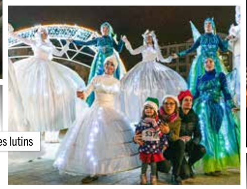
Balade des lutins