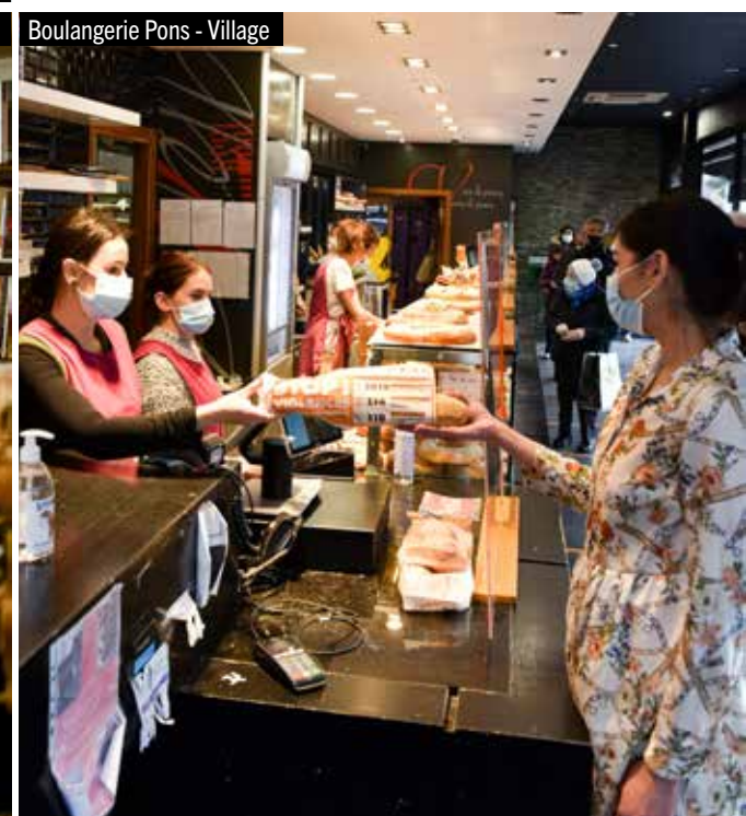
Boulangerie Pons - Village