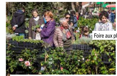
Foire aux plantes