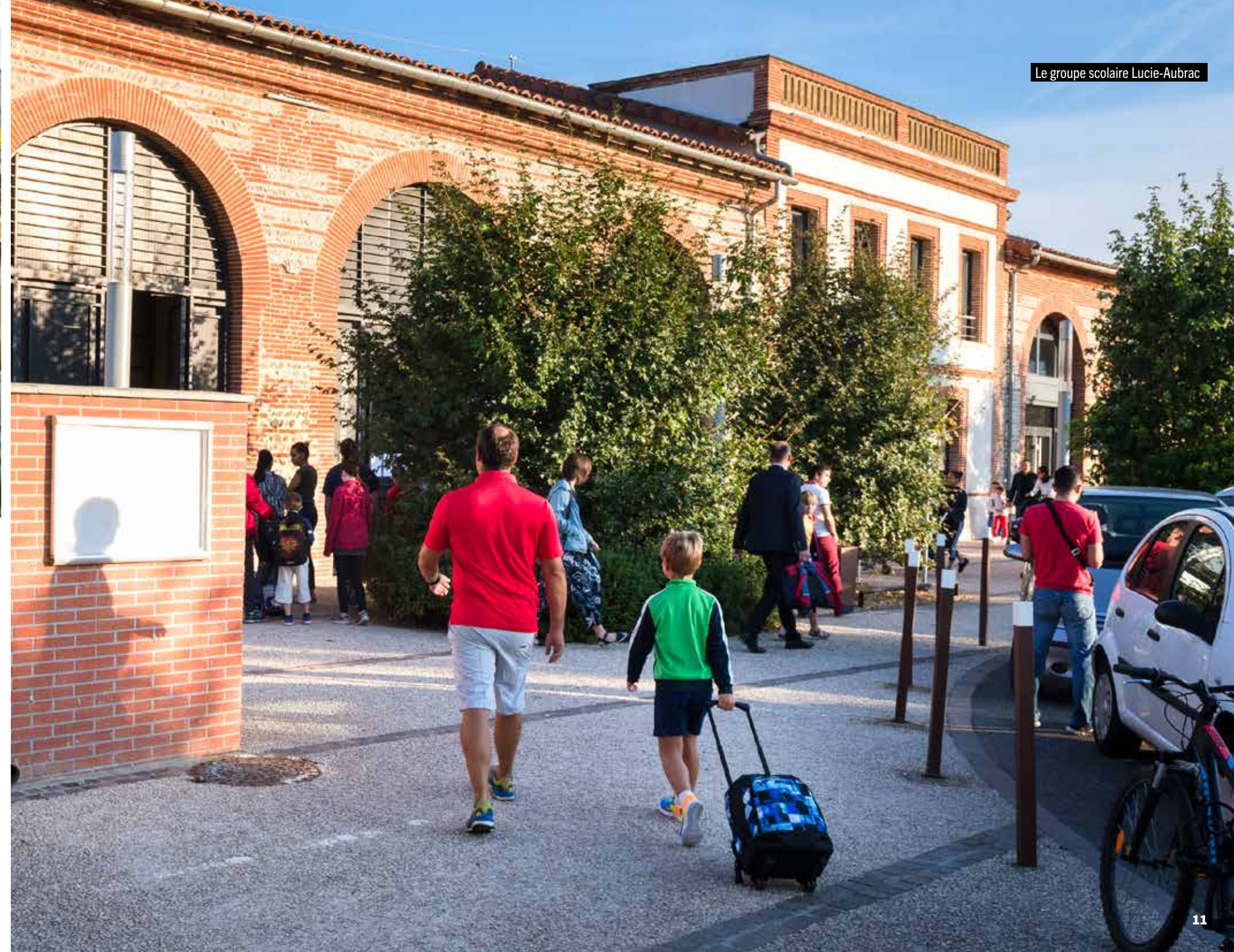
Le groupe scolaire Lucie-Aubrac

Elle est accompagnée de politiques sociales, éducatives, culturelles et sportives très dynamiques et innovantes. Cette offre de services publics attire de nombreuses familles et constitue le socle du bien-vivre ensemble. Les zones économiques et commerciales apportent une importante qualité de vie, autant que les nombreux espaces de respiration nature et loisirs.