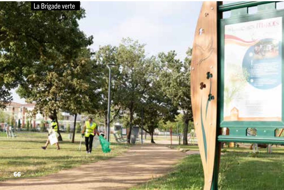
La Brigade verte