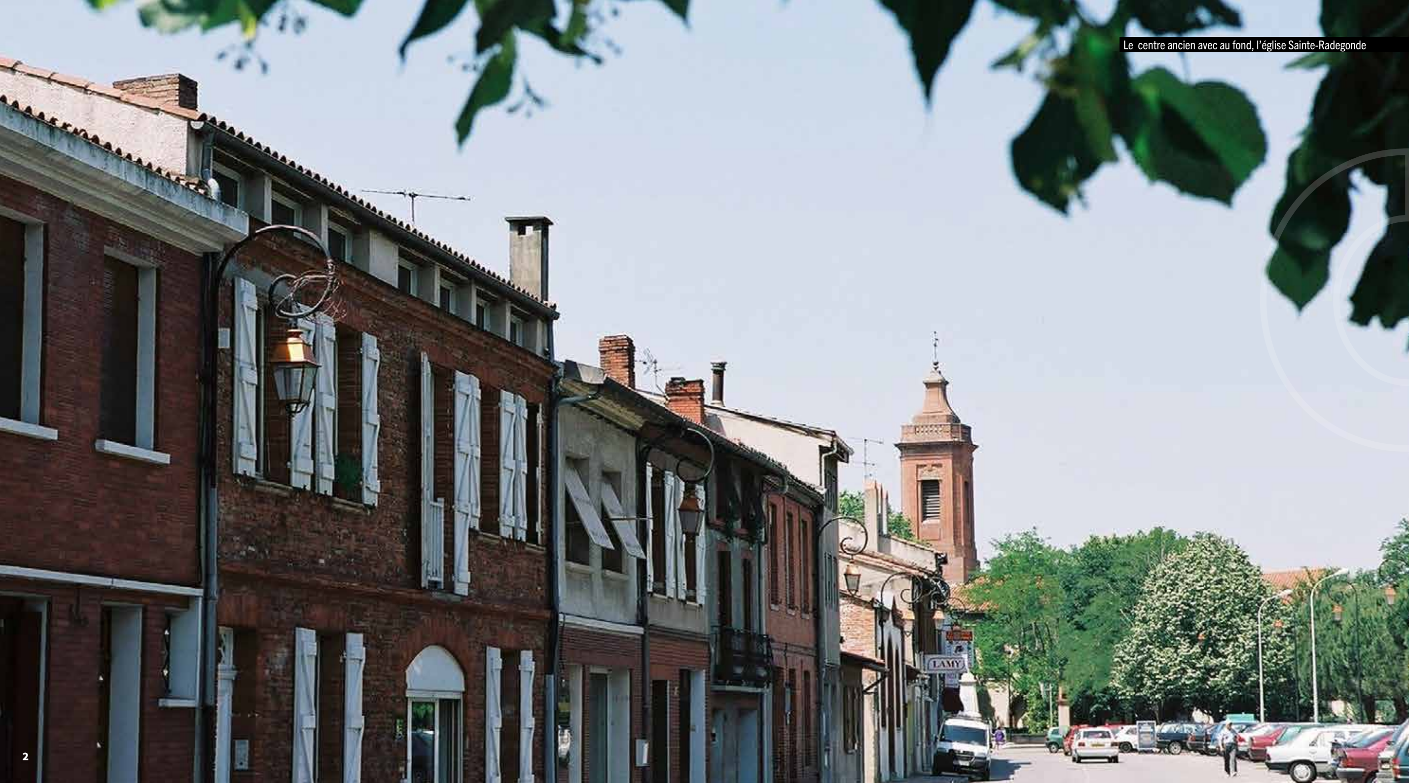
Le centre ancien avec au fond, l'église Sainte-Radegonde