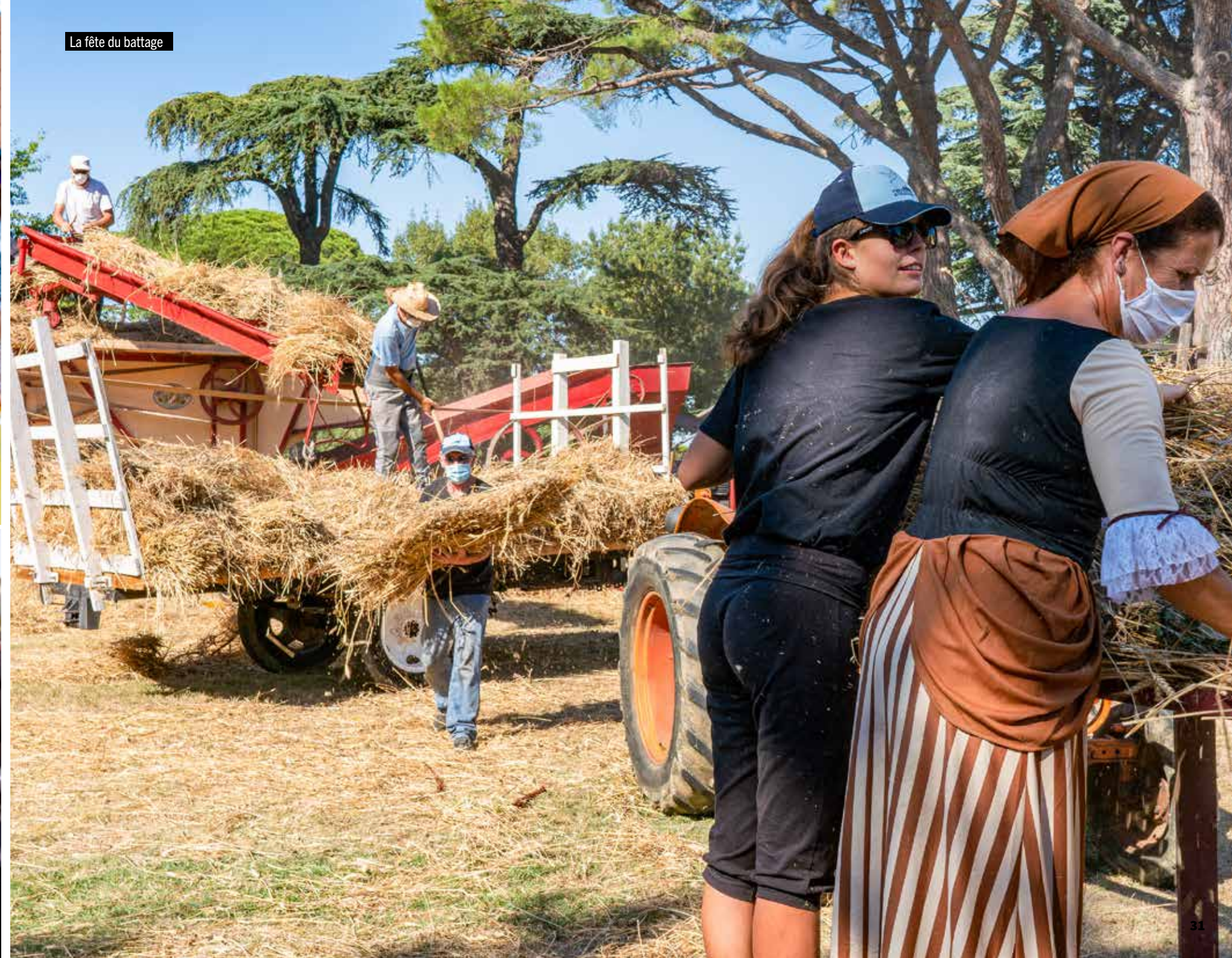
La fête du battage