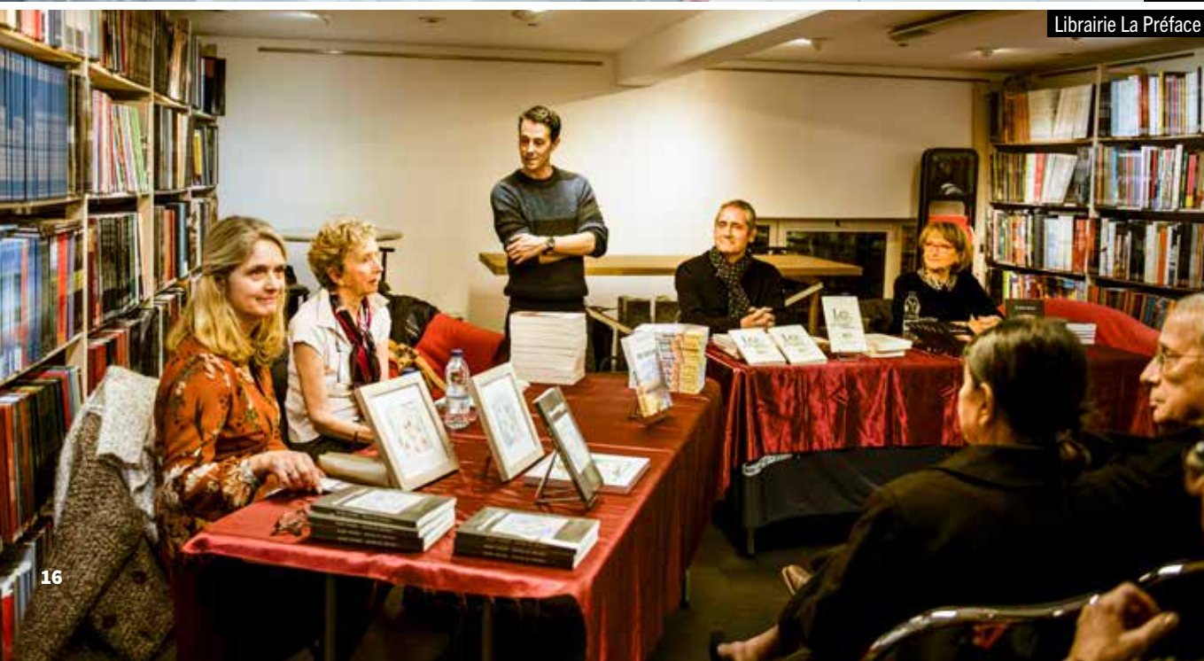
Librairie La Préface

L'expansion de Colomiers commence avec l'extraordinaire ascension de l'aéronautique française puis européenne. Le groupe international Airbus assemble dans les usines columérines l'A320, l'A330 et l'A350, ainsi que leurs versions neo. Aujourd'hui de nombreux secteurs d'activité performants sont présents à Colomiers qui a su se diversifier. Le nombre d'emplois sur son territoire est d'environ 27 600.