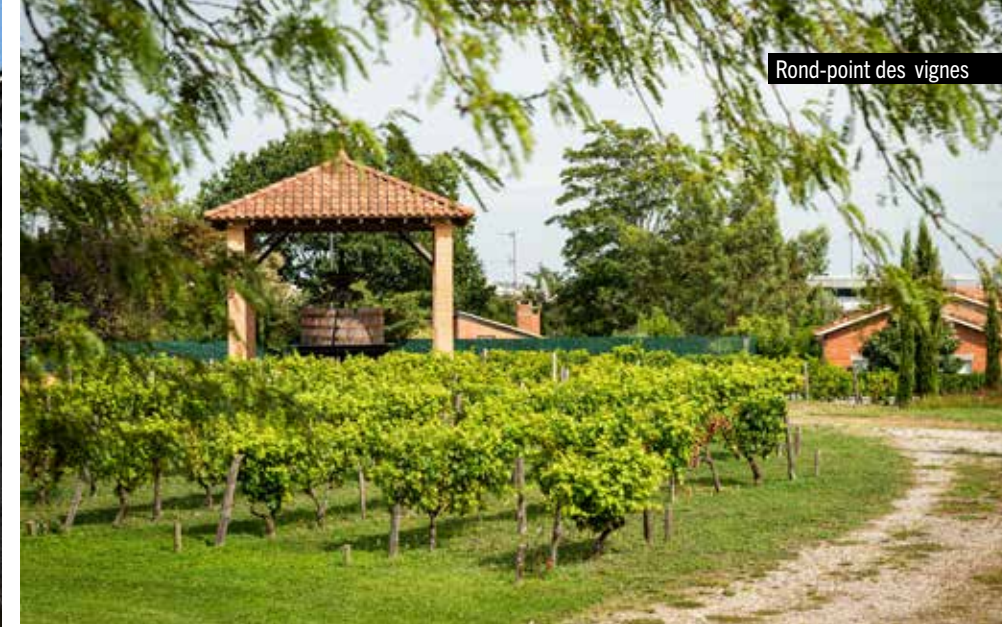
Rond-point des vignes