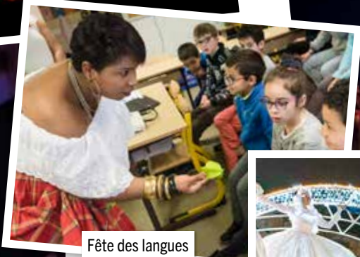
Fête des langues et des cultures