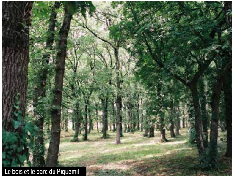
Le bois et le parc du Piquemil