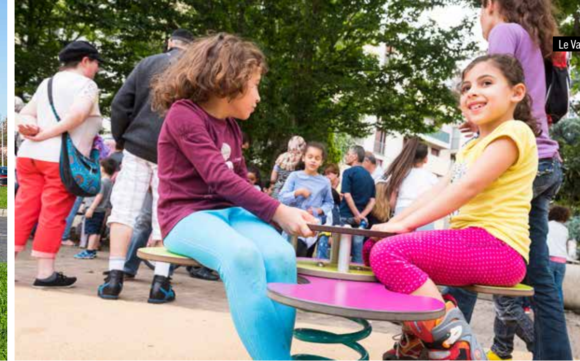
Le Val d'Aran