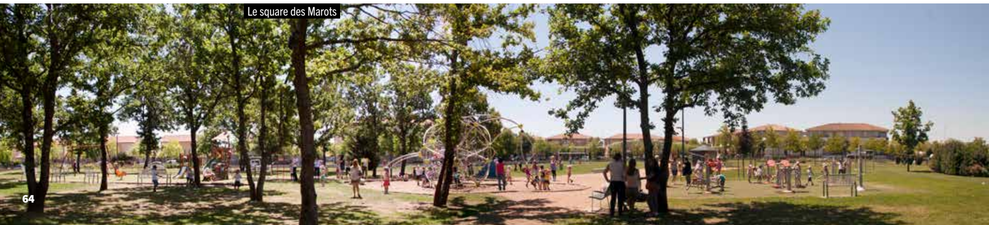
Le square des Marots