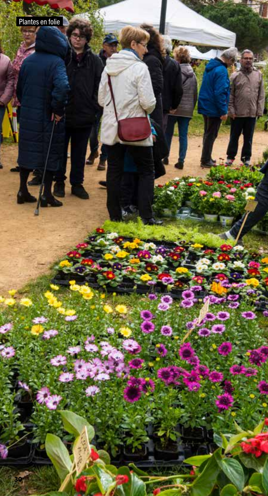
Plantes en folie