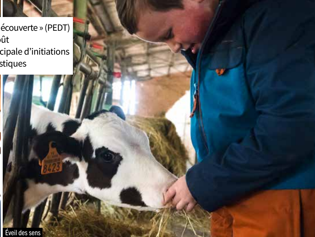
Éveil des sens