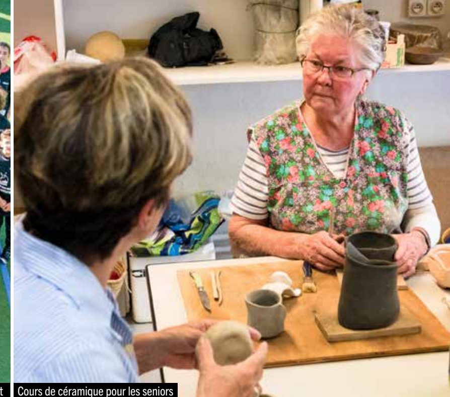
Cours de céramique pour les seniors