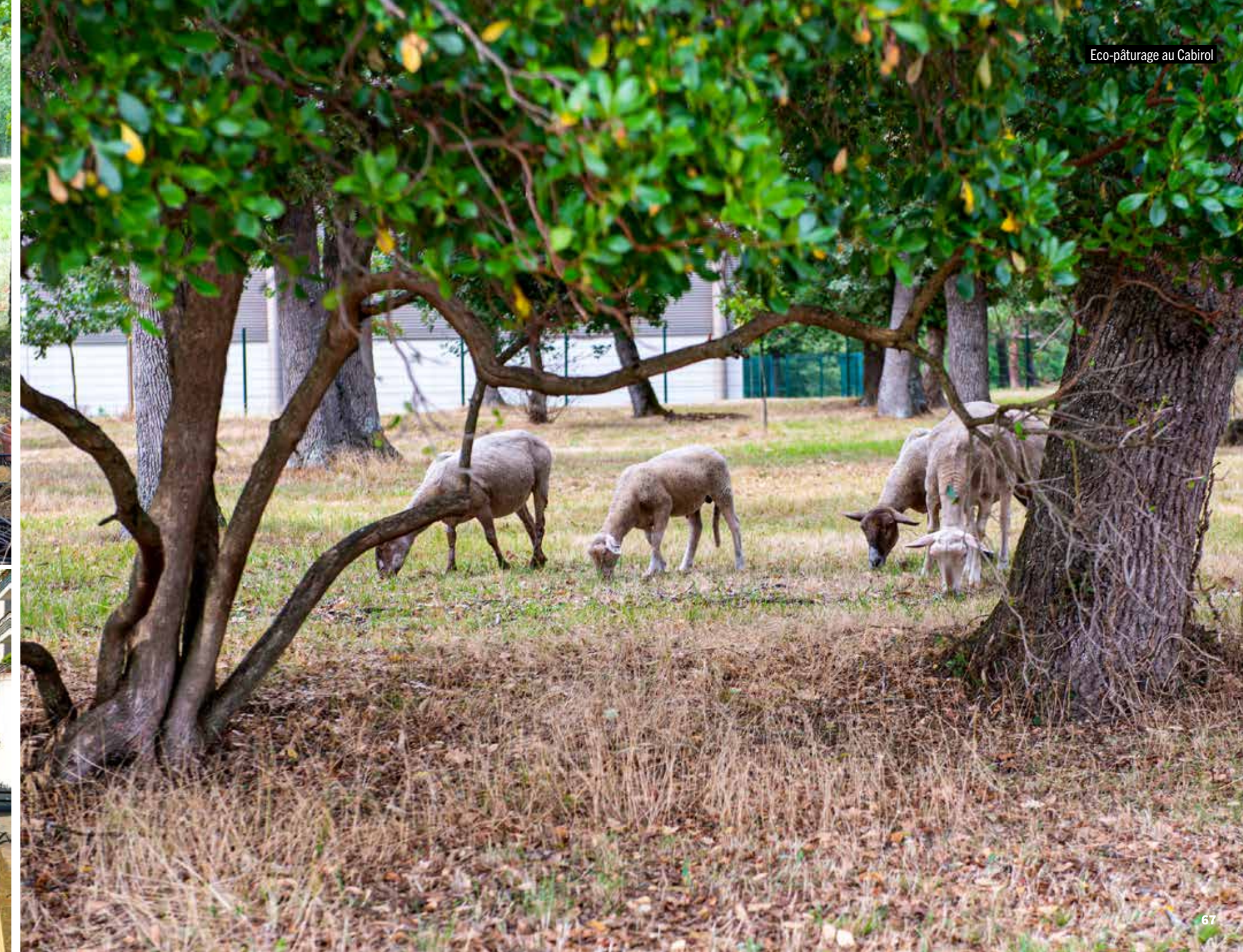
Eco-pâturage au Cabirol