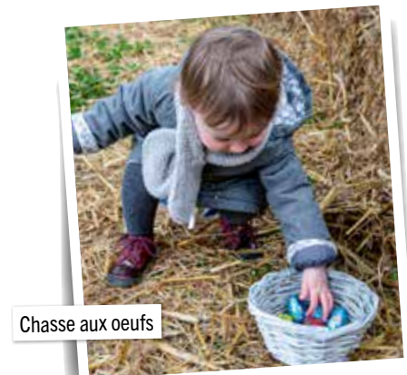
Chasse aux oeufs