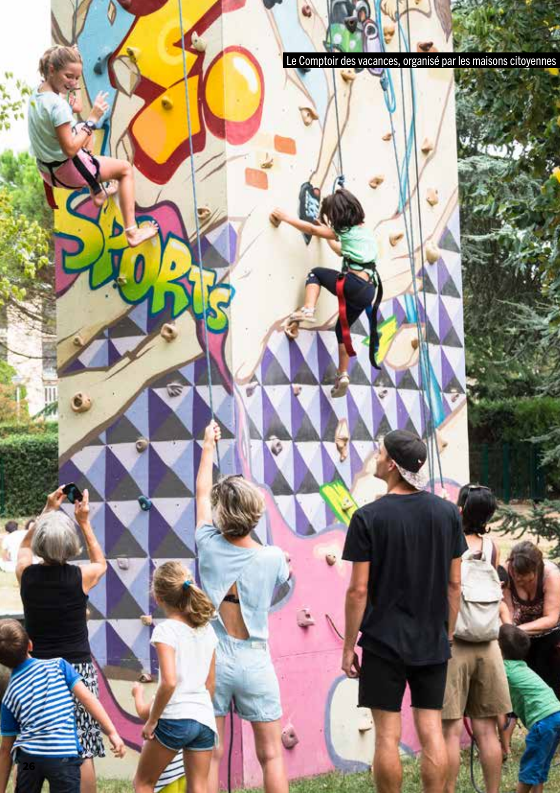
Le Comptoir des vacances, organisé par les maisons citoyennes