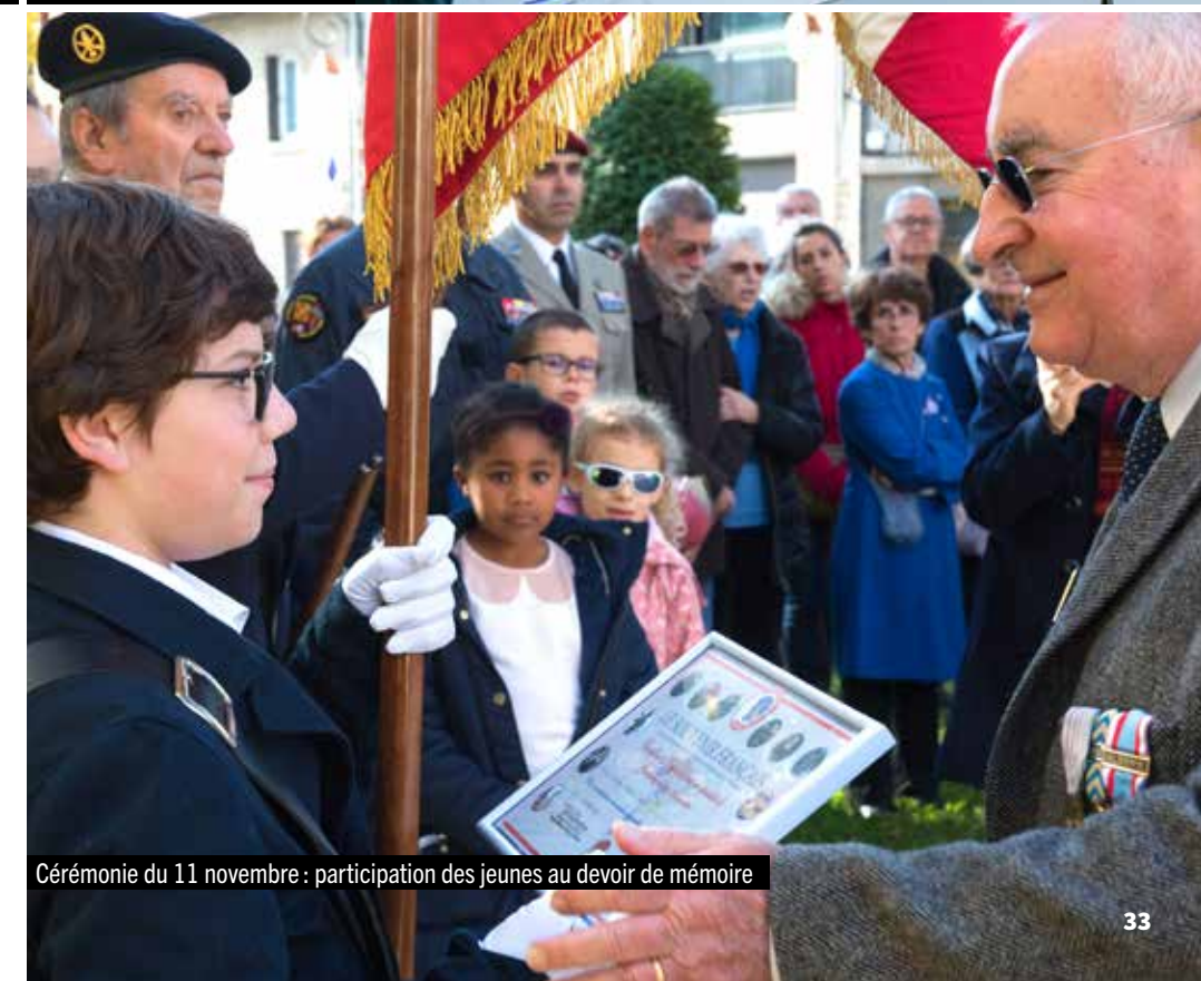
Cérémonie du 11 novembre : participation des jeunes au devoir de mémoire