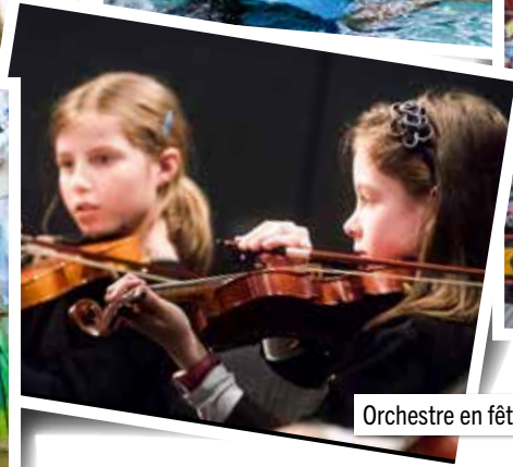
Orchestre en fête