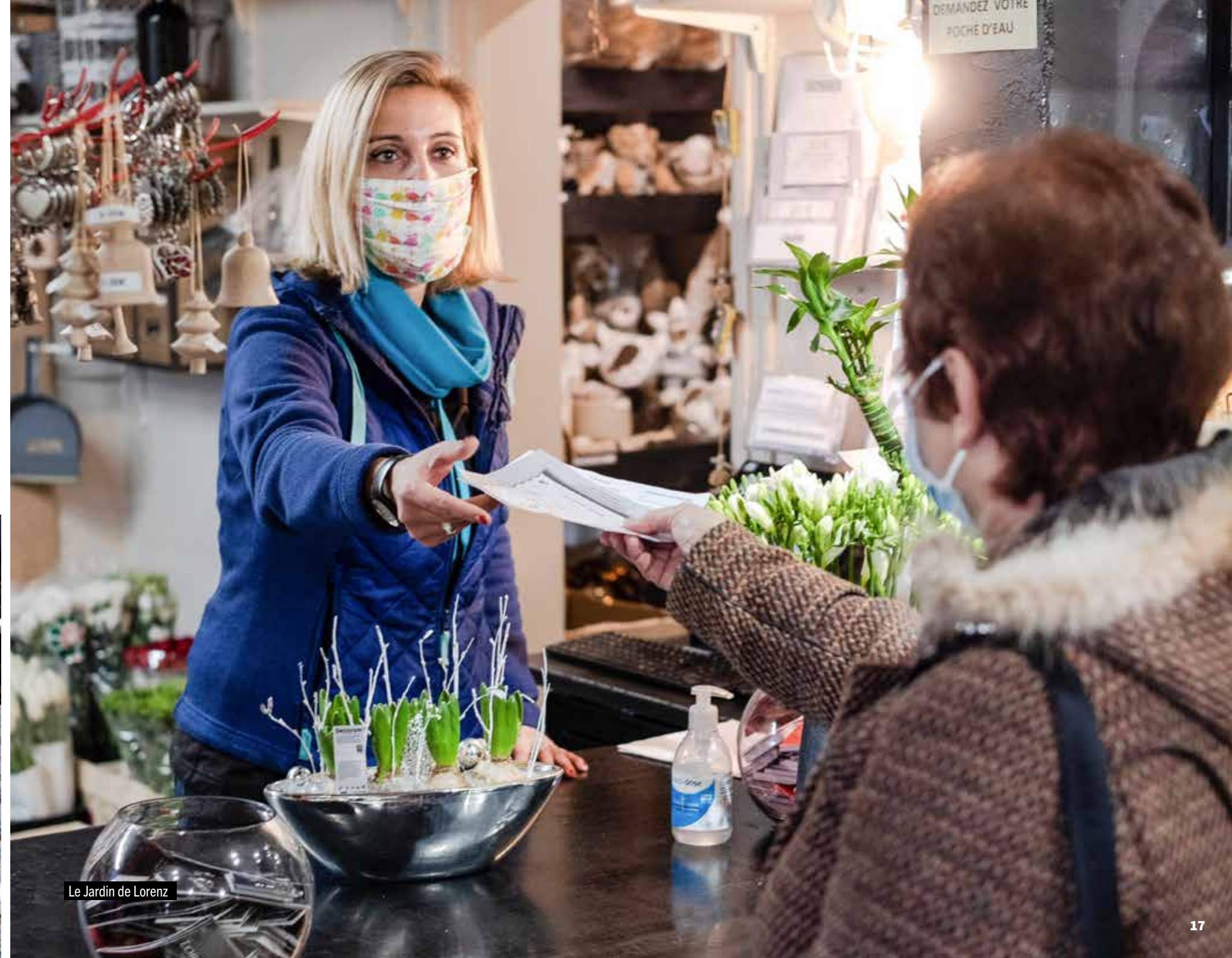
Le Jardin de Lorenz