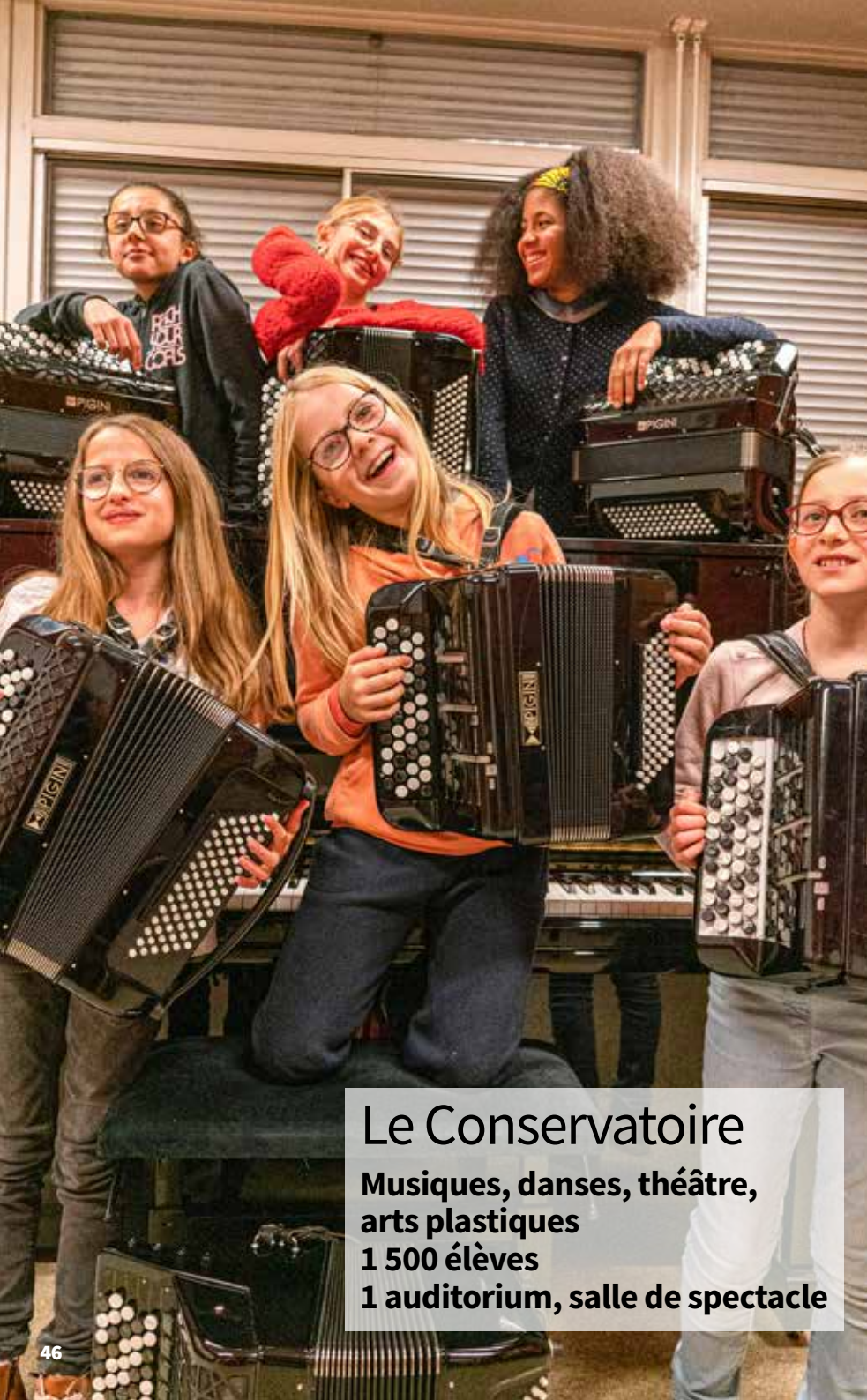
Le Conservatoire Musiques, danses, théâtre, arts plastiques 1 500 élèves 1 auditorium, salle de spectacle