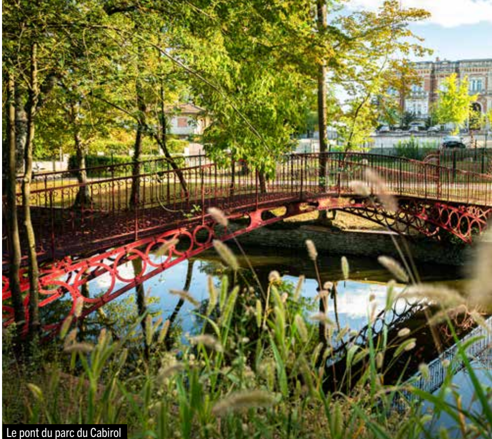
Le pont du parc du Cabirol