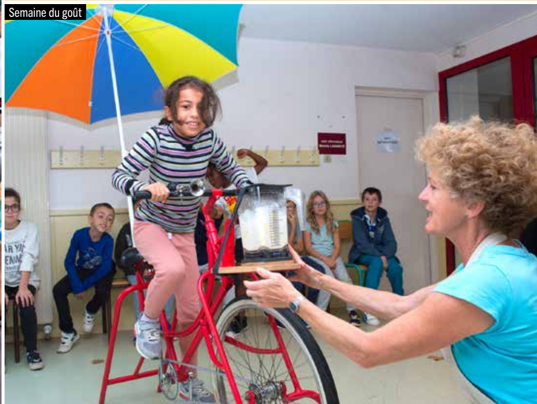
Semaine du goût