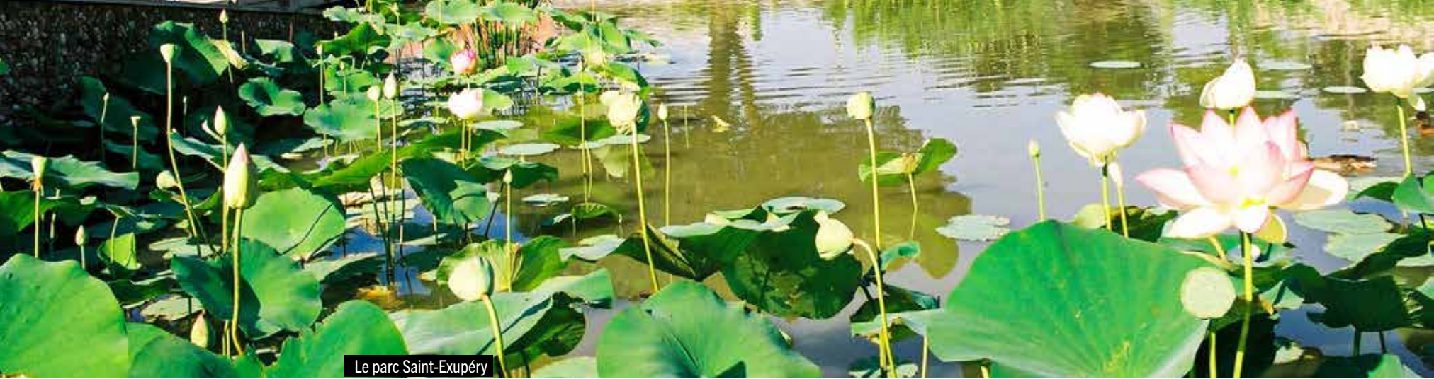
Le parc Saint-Exupéry