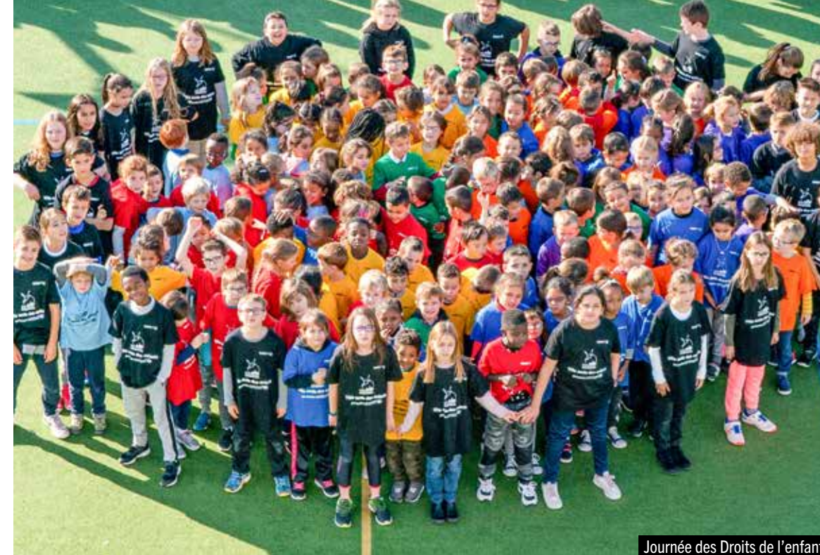
Journée des Droits de l'enfant

Enfin, la Commune souhaite lutter contre la fracture numérique, développer ses e-services et poursuivre ses initiatives de coopération internationale notamment avec la ville québécoise de Victoriaville... une ouverture des plus innovantes.