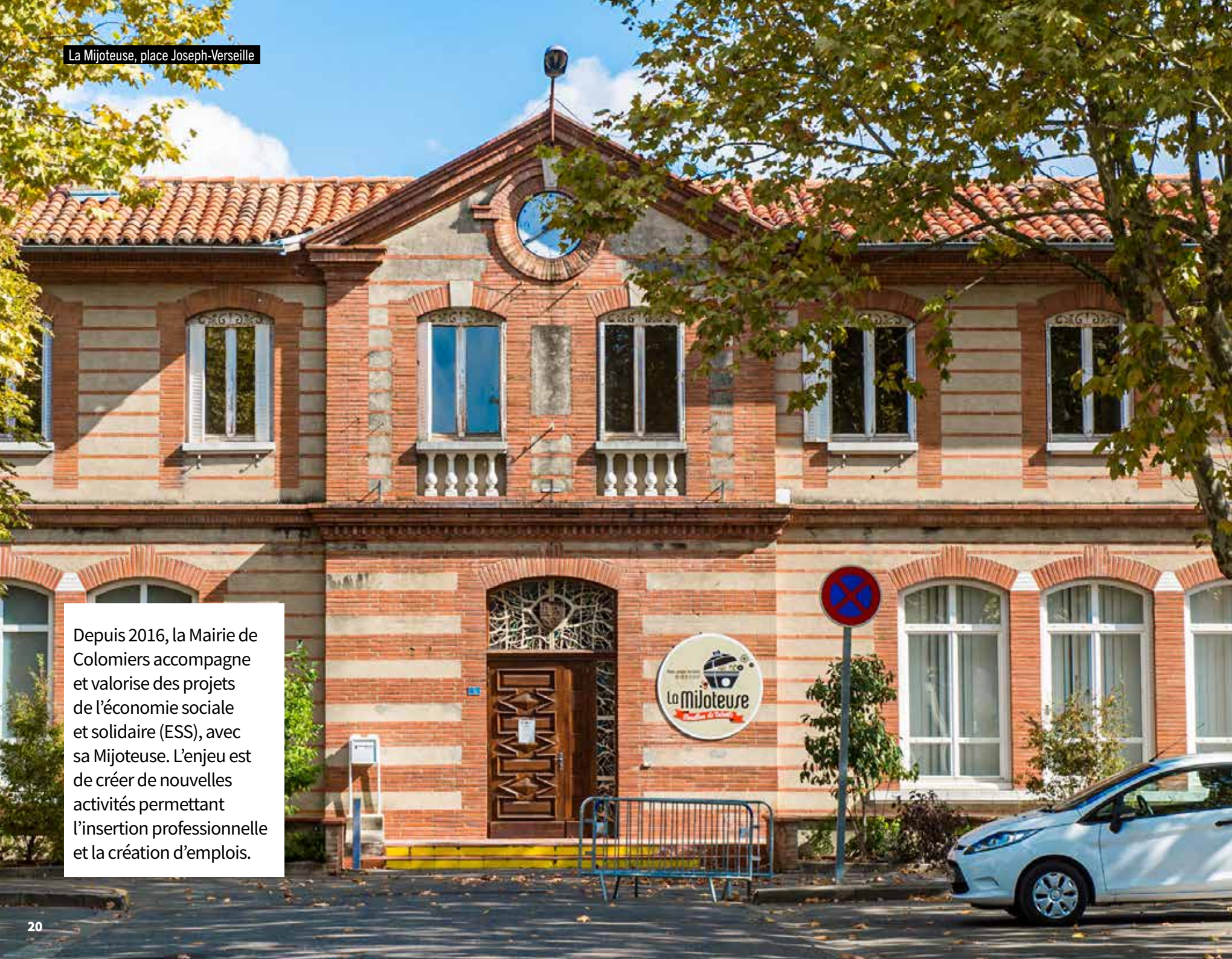
La Mijoteuse, place Joseph-Verseille

Depuis 2016, la Mairie de Colomiers accompagne et valorise des projets de l'économie sociale et solidaire (ESS), avec sa Mijoteuse. L'enjeu est de créer de nouvelles activités permettant l'insertion professionnelle et la création d'emplois.