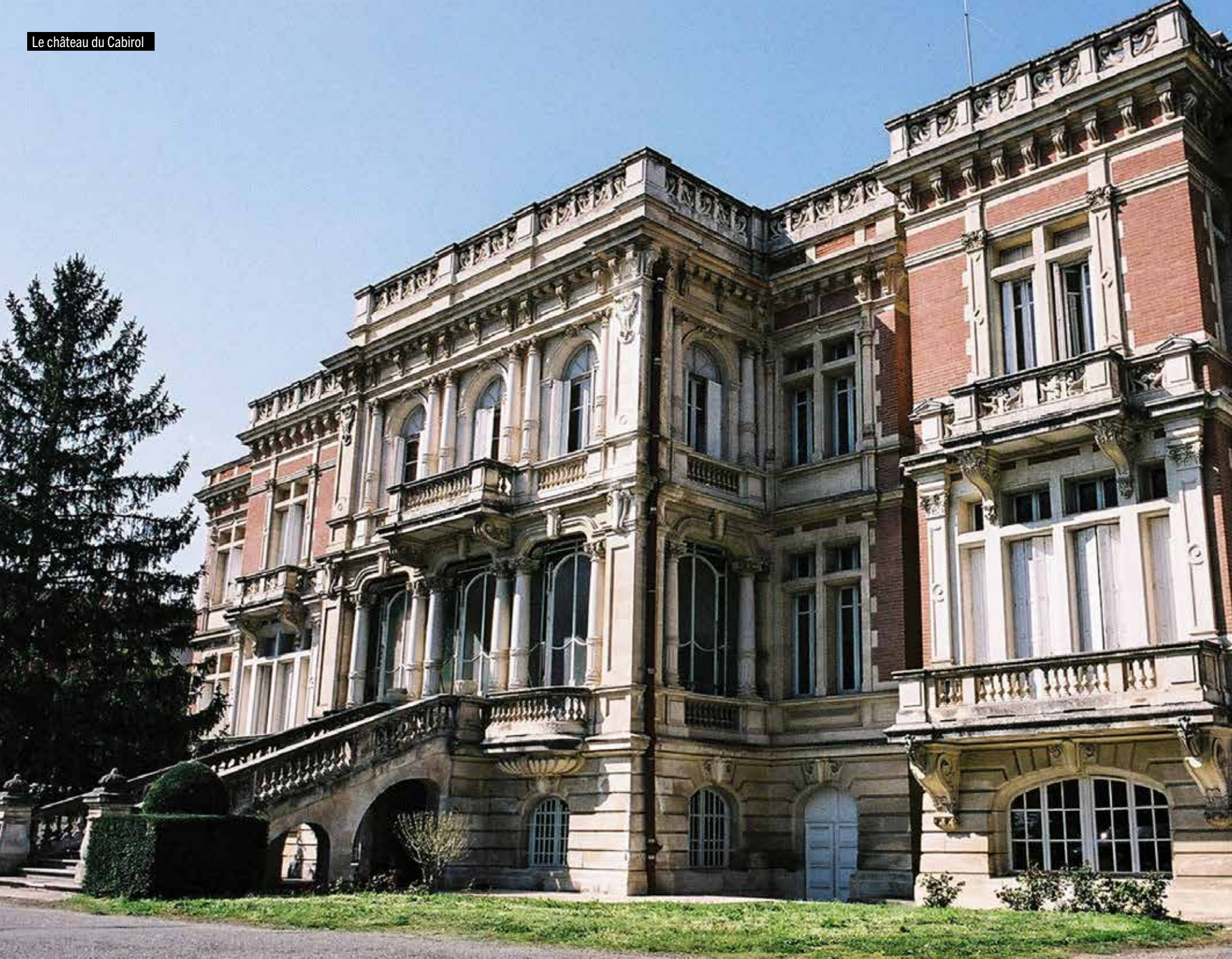
Le château du Cabirol