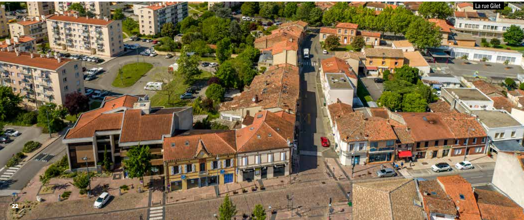
La rue Gilet