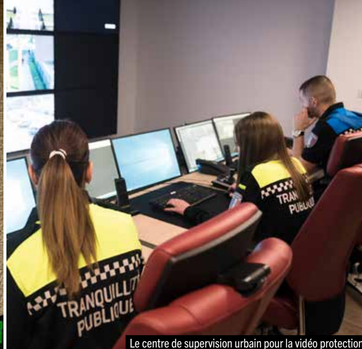
Le centre de supervision urbain pour la vidéo protection