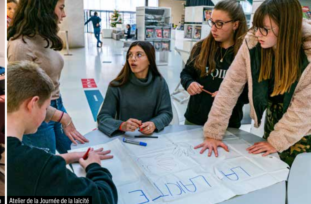
Atelier de la Journée de la laïcité

Pour assurer la tranquillité publique, la Ville de Colomiers s'appuie sur :