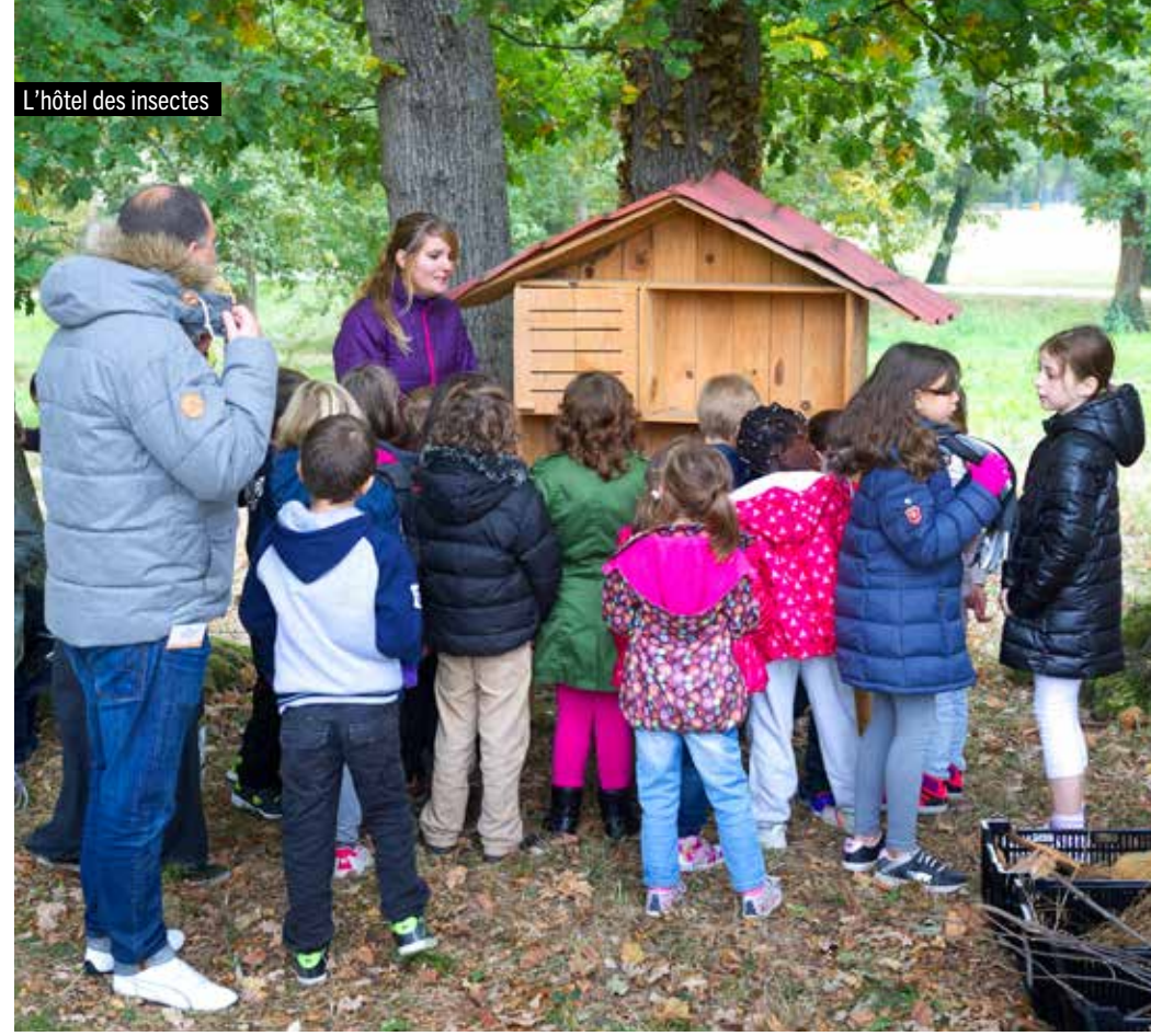
L'hôtel des insectes