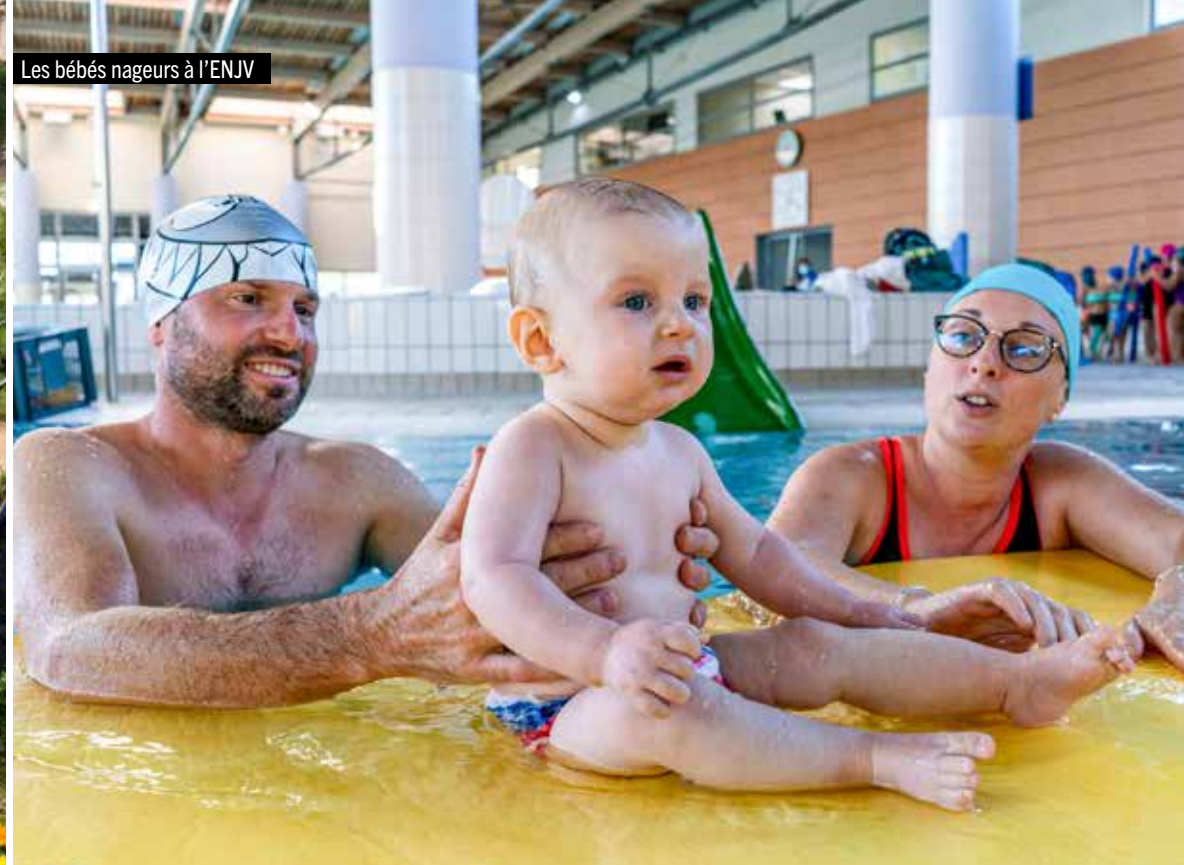
Les bébés nageurs à l'ENJV