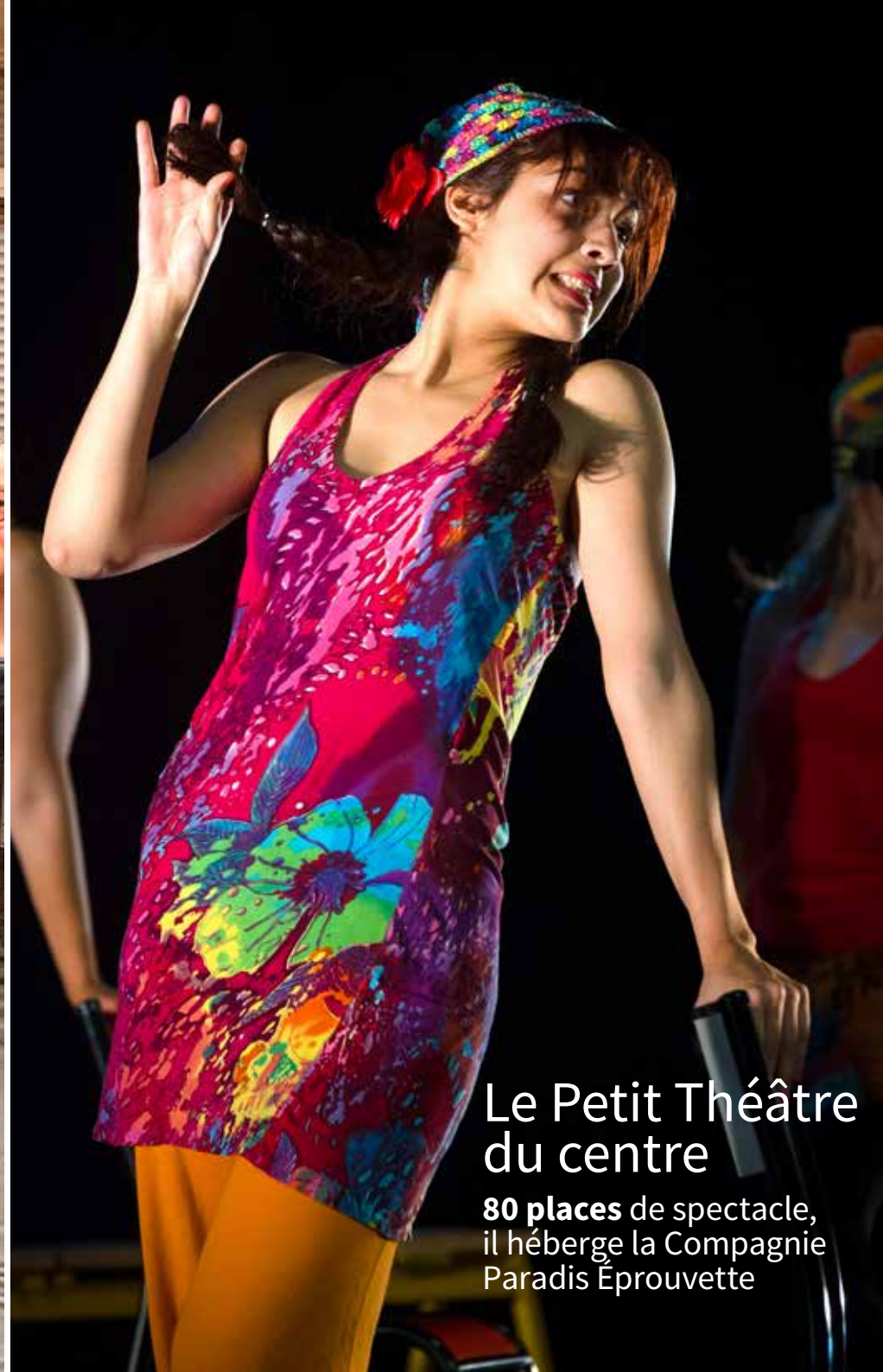
Le Petit Théâtre du centre 80 places de spectacle, il héberge la Compagnie Paradis Éprouvette