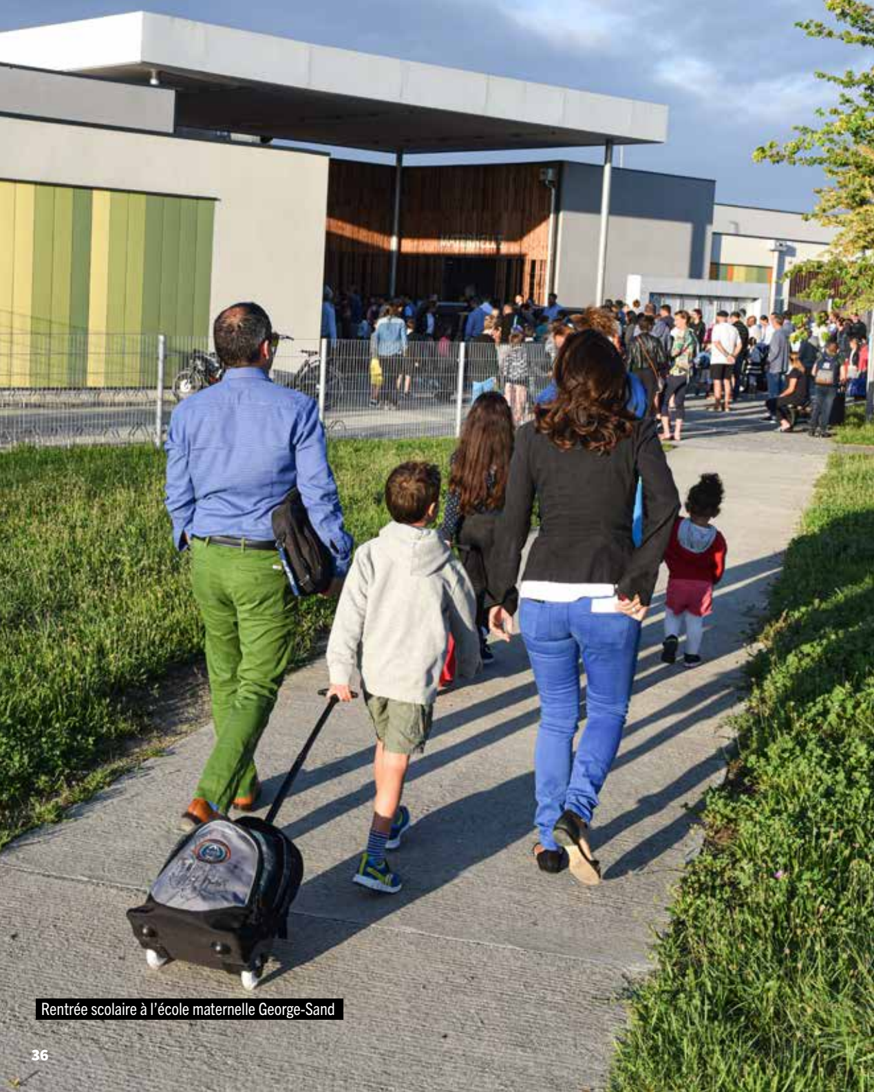
Rentrée scolaire à l'école maternelle George-Sand

La Commune a engagé un programme pluriannuel de rénovation de ses plus anciennes écoles. Après la création des deux groupes scolaires Lucie-Aubrac et George-Sand, l'extension du groupe scolaire Alain-Savary, la rénovation complète de la maternelle Jules-Ferry... La future école élémentaire Simone-Veil est en cours de chantier pour une ouverture au troisième trimestre 2021. Par ailleurs, la Commune a lancé l'opération « Dessine-moi ta cour » dont l'enjeu est de repenser toutes les cours d'école de manière partenariale avec l'ensemble des acteurs concernés dont les enfants.