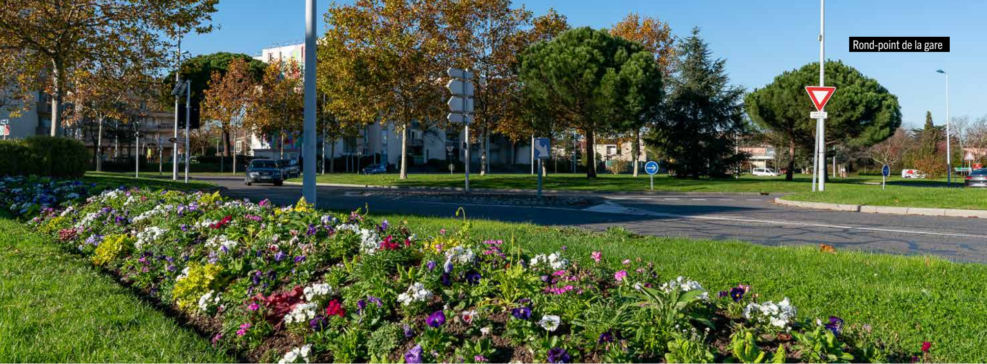
Rond-point de la gare