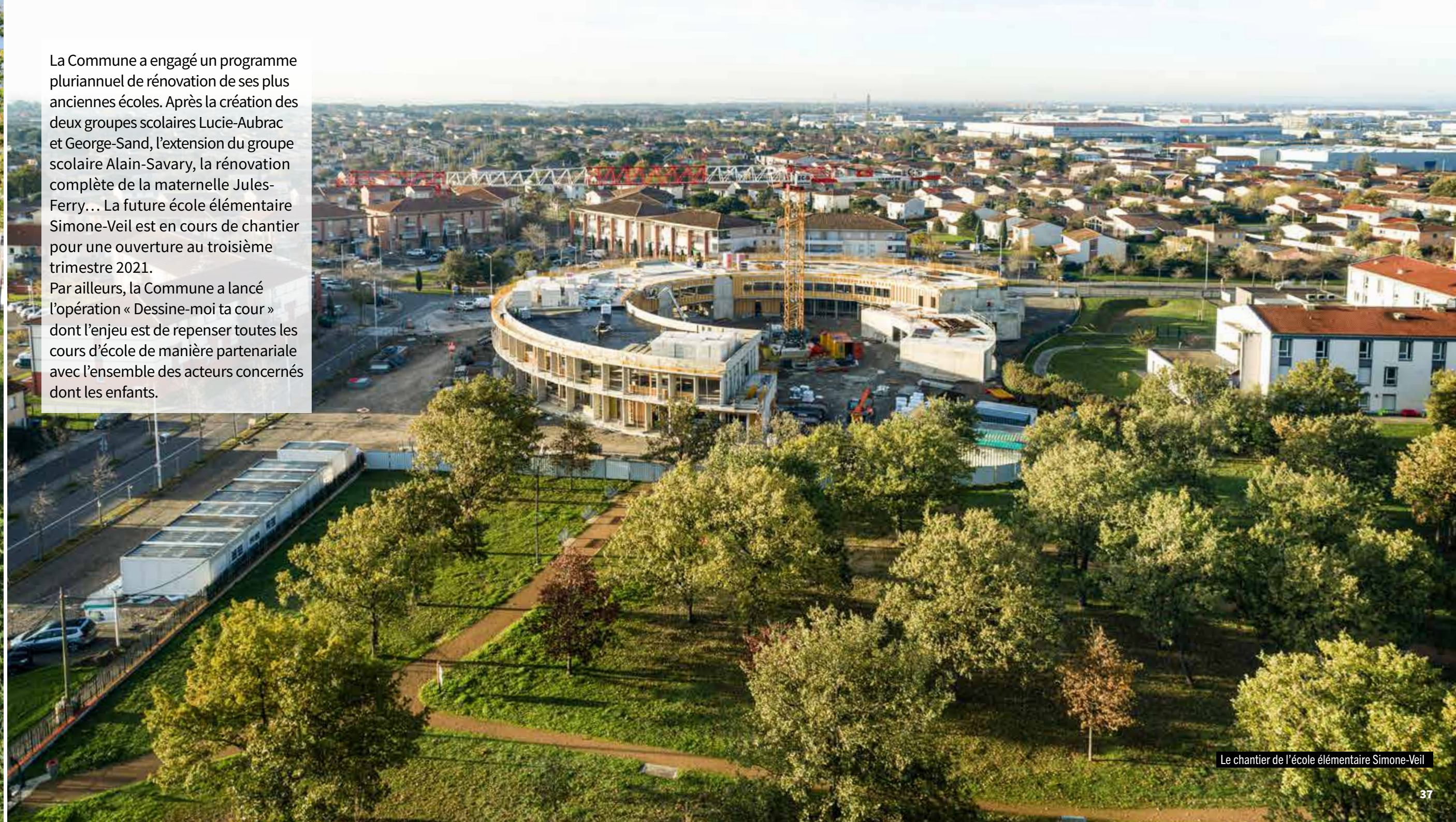
Le chantier de l'école élémentaire Simone-Veil

La Commune a engagé un programme pluriannuel de rénovation de ses plus anciennes écoles. Après la création des deux groupes scolaires Lucie-Aubrac et George-Sand, l'extension du groupe scolaire Alain-Savary, la rénovation complète de la maternelle Jules-Ferry... La future école élémentaire Simone-Veil est en cours de chantier pour une ouverture au troisième trimestre 2021. Par ailleurs, la Commune a lancé l'opération « Dessine-moi ta cour » dont l'enjeu est de repenser toutes les cours d'école de manière partenariale avec l'ensemble des acteurs concernés dont les enfants.