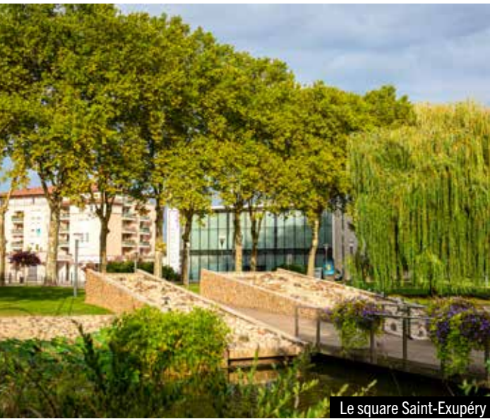
Le square Saint-Exupéry